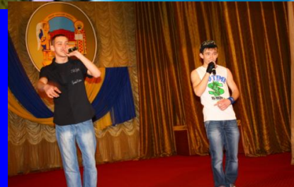
Курсанти ВІКНУ з успіхом виступили на «Арт – Сузір'ї»