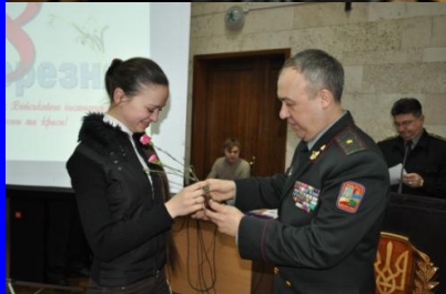
У ВІКНУ відсвяткували Міжнародний день захисту прав жінок та миру