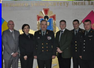
Вивчаємо досвід підготовки фахівців з правових питань у Збройних силах Королівства Норвегія